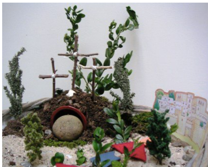
vendredi st tombeau fermé